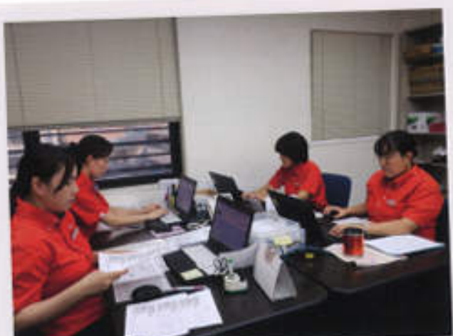
サポートセンターの業務風景 皆さまから届く日報を1枚1枚目を通し、マーカーを入れ、日々社内に配信しています