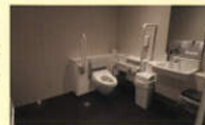
みんなのトイレ・水回り