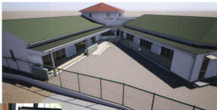
↑みどりがおか幼稚園 外観パース