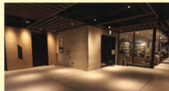
エレベーターホール前