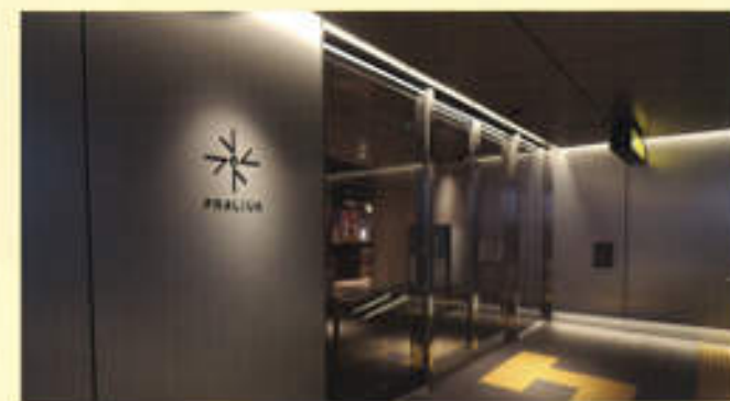
地下鉄西新駅直結の店内入口

令和元年7月より福岡市早良区西新にオープンした、プラリバ内の清掃業務が当社でスタートしました。地下2階、地上4階建てのテナントビルです。