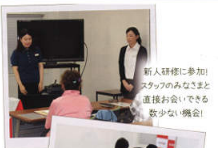
新人研修に参加！ スタッフのみならずと 直接お会いできる 数少ない機会！

「日々頑張っています」でも構いません。是非、日報の提出にご協力お願いいたします！