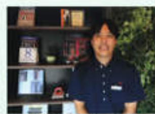
期待のニューフェイス