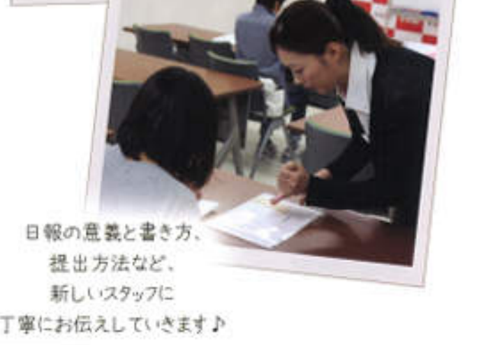
日報の意義と書き方、 提出方法など、 新しいスタッフに 丁寧に教えています！